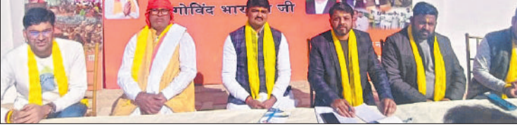
नारनौल। महासम्मेलन की जानकारी देते हुए।