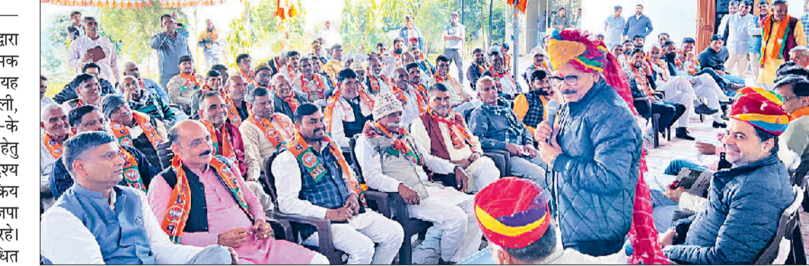
नारनौल। बैठक में मौजूद भाजपा सदस्य।

चुनाव सूचना दी महेंद्रगढ़ जिला सहकारी श्रम एवं निर्माण प्रसंग लि० नारनौल के सभी अंशधारकों को सूचित किया जाता है कि प्रसंग के वर्तमान निदेशक मण्डल का कार्यकाल दिनांक 18-02-2026 को समाप्त होने जा रहा है। प्रसंग के अगले निदेशक मण्डल के चुनाव हेतु प्रसंग की जोनल कमेटी ने दिनांक 19-12-2025 को अपनी बैठक में प्रस्तावित जोनल सूचियों को प्रयोगात्मक रूप से अनुमोदित कर दिया है। इन सूचियों को दिनांक 22.12.2025 से 05.01.2026 तक निम्न स्थानों पर प्रदर्शित किया जा रहा है :- 1. उप रजिस्ट्रार, सहकारी समितियों, भिवानी कार्यालय 2. सहायक रजिस्ट्रार, सहकारी समितियों, नारनौल व महेंद्रगढ़ कार्यालय 3. दी महेंद्रगढ़ केन्द्रीय सहकारी बैंक लि० महेंद्रगढ़ व शाखा नारनौल में 4. प्रसंग के हाऊसिंग बोर्ड नारनौल में स्थित कार्यालय में यदि किसी अंशधारक समिति को इन प्रयोगात्मक रूप से अनुमोदित जोनल सूचियों के सम्बन्ध में कोई आपत्ति हो तो वह दिनांक 05.01.2026 तक प्रबन्धक प्रसंग को अपने ऐतराज लिखित रूप में प्रस्तुत करें। इसके बाद दिनांक 06.01.2026 को जोनल कमेटी द्वारा सायं दो बजे ऐतराजों पर विचार कर निपटारा किया जायेगा। उसके बाद अन्तिम रूप से जोनल सूचियों को अनुमोदित कर एक जोनल अनुसूचित जाति, दो जोनल महिला वर्ग व एक जोनल पिछड़ा वर्ग के लिए ड्रा द्वारा आरक्षित किया जायेगा।