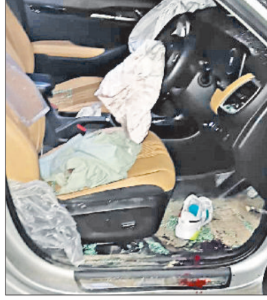
नारनौल। क्षतिग्रस्त गाड़ी व बिखरा पड़ा सामान।