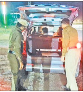
नारनौल। वाहन की जांच करते पुलिस कर्मी।

पुलिस ने चलाया चेंकिंग अभियान नारनौल। जिले में अपराधिक गतिविधियों पर नकेल कसने के उद्देश्य से पुलिस प्रशासन ने एक व्यापक और सचन वाहन चेंकिंग अभियान चलाया। इस विशेष अभियान के तहत जिले के सभी प्रमुख मार्गों और सीमावर्ती नाकों पर नाकाबंदी कर पुलिस की विभिन्न टीमों ने मुस्तैदी से वाहनों की जांच की। सुरक्षा और कानून व्यवस्था के उद्देश्य से इस कार्यवाही में हर छोटे-बड़े वाहन की गहनता से तलाशी ली गई। नियमों की अनदेखी करने वालों पर पुलिस ने सख्ती दिखाई और यातायात नियमों का उल्लंघन करने वाले तथा अधूरे दस्तावेजों वाले अनेक वाहनों के तत्काल चालान काटे गए।