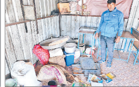
निजामपुर। चोरी की वारदात के बाद दुकान में बिखरा पड़ा सामान।