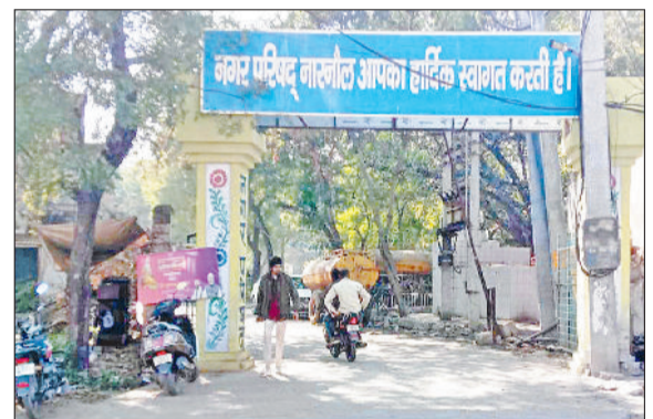
नारनौल। नगर परिषद कार्यालय।

नगर परिषद ने हाउस टैक्स के बकायेदारों के लिए खतों की घंटी बजा दी है। परिषद ने इन बकायेदारों को नोटिस और हाउस टैक्स के बिल जारी किए हैं, जिसमें उन्हें एक सप्ताह में बकाया हाउस टैक्स जमा कराने के लिए कहा गया है। नोटिस में चला-अचल संपत्ति कुर्क करवाई जाएगी