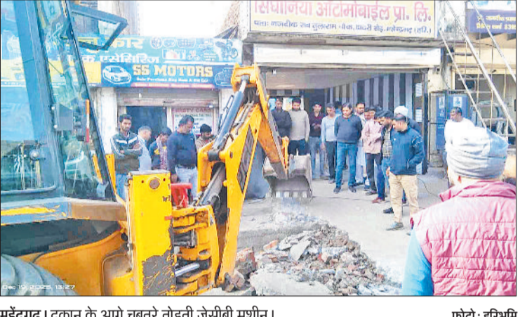
महेंद्रगढ़। दुकान के आगे चबूतरे तोड़ती जेसीबी मशीन।

नगर पालिका टीम द्वारा शुक्रवार को बड़े स्तर पर अतिक्रमण हटाओ अभियान चलाया गया। टीम ने विभिन्न बाजारों में दौरा कर दुकानों के बाहर रखा सामान जब्त किया। इसके अलावा रोड पर बने चबूतरे की जेसीबी मशीन की सहायता से हटवाया गया। हालांकि शहर के दुकानदारों ने प्रशासनिक चेतावनी के बाद बाजार के अधिकांश दुकानदारों ने स्वेच्छा से अपने रोड, अवैध निर्माण और सड़क किनारे रखे सामान को हटा लिया था। इससे न केवल रोड पर बने चबूतरे हट चुके हैं, बल्कि यातायात भी सुचारू होने लगा है। सुबह से बाजार में गतिविधि तेज हो गई और दोपहर तक सड़क किनारे का अधिकांश हिस्सा पूरी तरह खाली हो गया। इससे यातायात सामान्य हो गया और लोगों को आवागमन में काफी राहत मिली। स्थानीय निवासियों का कहना है कि अतिक्रमण हटने से जाम की समस्या में बड़ी कमी आएगी, खासकर त्योहारों के समय। शहर के दुकानदारों का कहना है कि प्रशासन ने समय रहते चेतावनी दी, इसलिए हमने खुद ही शोध हटा लिया। यह कदम सबके हित में है। इसके अलावा शहर का सबसे बड़ा शांति