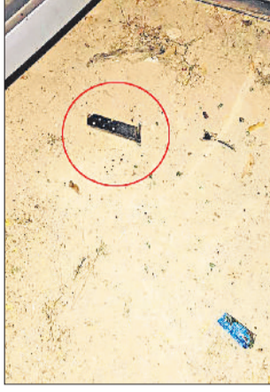
नारनौल। घटनास्थल पर पड़ी मैगजीन।